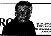
ESTA COLUNA É PUBLICADA DE SEGUNDA A DOMINGO