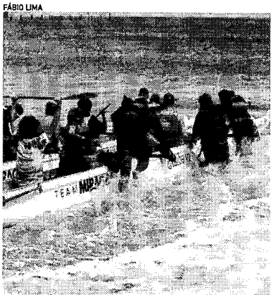
PROJETO usou canoa havaiana para passeio de pessoas com deficiência

| PRAIA ACESSÍVEL | Projeto Remar deve ocorrer ao menos uma vez no mês. Iniciativa surgiu em meados de 2013 na Lagoa do Colosso