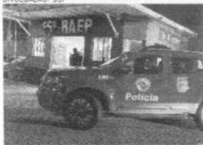
OPERAÇÃO do Ministério Público de São Paulo prendeu três vereadores por suspeita de envolvimento com facção criminosa