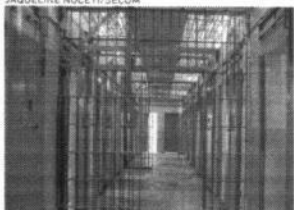
SAIDINHA de detentos das penitenciárias virou alvo dos legisladores