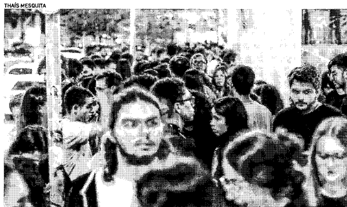
SAÍDA DO SEGUNDO dia de prova do ENEM na Uninassau, na avenida Aguanambi

| ENEM 2022 | O segundo dia de exame foi realizado neste domingo, 20. Veja próximas datas importantes