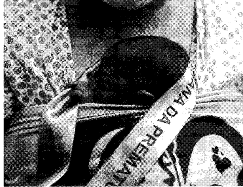
BEBÊS usaram a cor roxa no Hospital César Cals